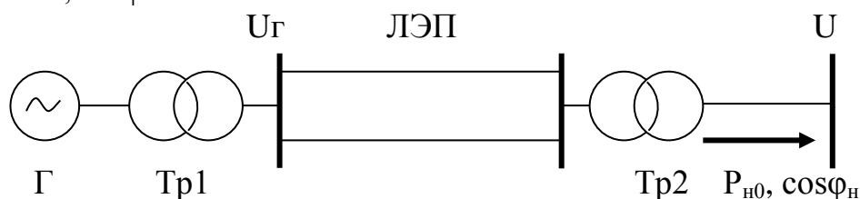
Рис. 1 Схема электропередачи

P_{H0} = 30 МВт; \cos \varphi_H = 0,85 .