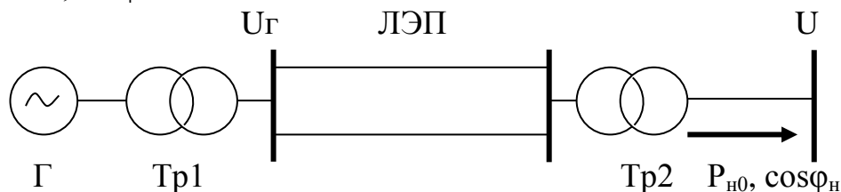
Рис. 1 Схема электропередачи

P_{H0} = 30 МВт; \cos \varphi_H = 0,85 .